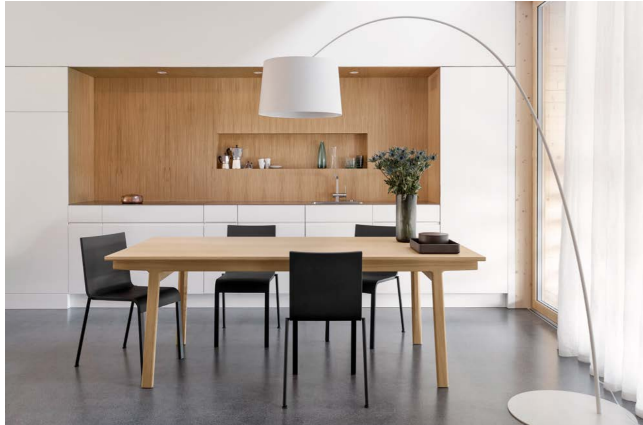
Untergestell Eiche, natur lackiert Platte Eiche, natur lackiert Kante K 06

Auf den Längsholmen des Untergestells lässt sich das Tischblatt elegant verschieben. Dabei legt es die aus Massivholz gefertigte Gestellstruktur und das verborgene Erweiterungselement frei. Die handliche Einlage ist wahlweise in massivem Holz oder in einer Leichtbaukonstruktion mit schwarzem Kern und einem hochwertigen, äusserst kratzfesten Belag in FENIX NTM erhältlich. Mit eingesetzter Tischverlängerung entsteht im Nu Platz für vier weitere Gäste.