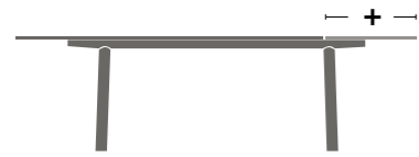
Auszugstisch Extendable table