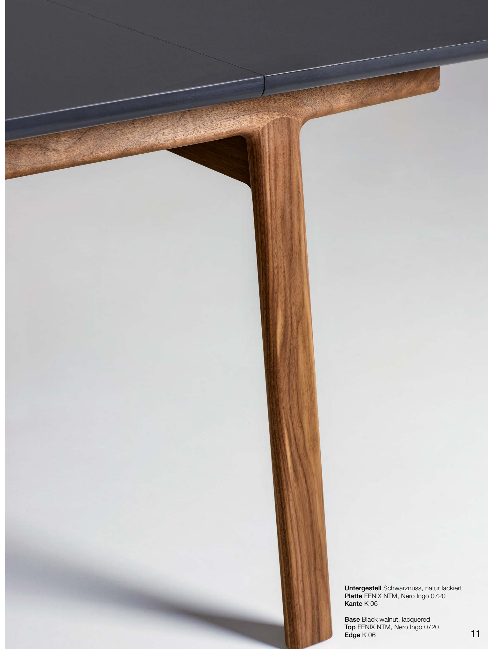
Base Black walnut, lacquered Top FENIX NTM, Nero Ingo 0720 Edge K 06