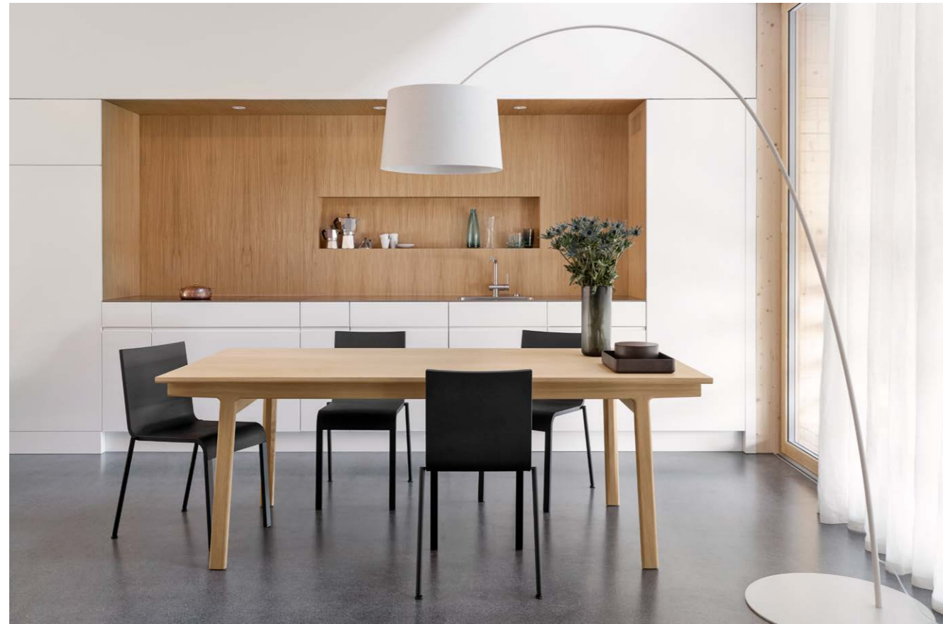
Untergestell Eiche, natur lackiert Platte Eiche, natur lackiert Kante K 06

Auf den Längsholmen des Untergestells lässt sich das Tischblatt elegant verschieben. Dabei legt es die aus Massivholz gefertigte Gestellstruktur und das verborgene Erweiterungselement frei. Die handliche Einlage ist wahlweise in massivem Holz oder in einer Leichtbaukonstruktion mit schwarzem Kern und einem hochwertigen, äusserst kratzfesten Belag in FENIX NTM erhältlich. Mit eingesetzter Tischverlängerung entsteht im Nu Platz für vier weitere Gäste.